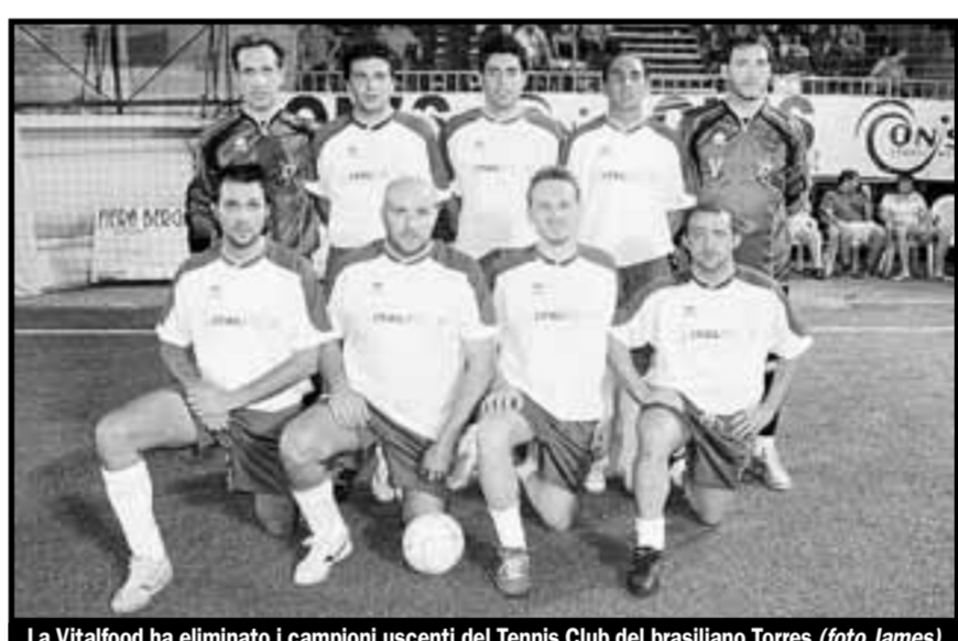
La Vitalfood ha eliminato i campioni uscenti del Tennis Club del brasiliano Torres

PLAY TV: Arcuri, Bruno, Battaglia, Barzè, Eklic, Belloni, Bargellini.