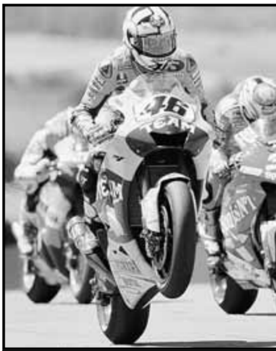
Valentino Rossi vuole vincere a Laguna Seca

Lo statunitense Kenny Roberts jr. ha ottenuto il miglior tempo nelle prime prove libere del Gran Premio degli Stati Uniti, classe MotoGP, in programma domenica sul circuito di Laguna Seca. Roberts, su Honda-KR11V, ha fermato il cronometro sul tempo di 1'23"951, davanti alla Yamaha di Colin Edwards e alla Honda di Casey Stoner. Quinto tempo per Valentino Rossi, sesto per Marco Melandri e settimo per Nicky Hayden, attuale leader del Mondiale. In tarda serata si sono poi svolte le seconde prove libere.